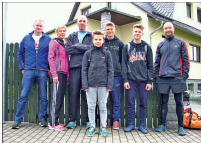
Die Mannschaft der Rennsocken I