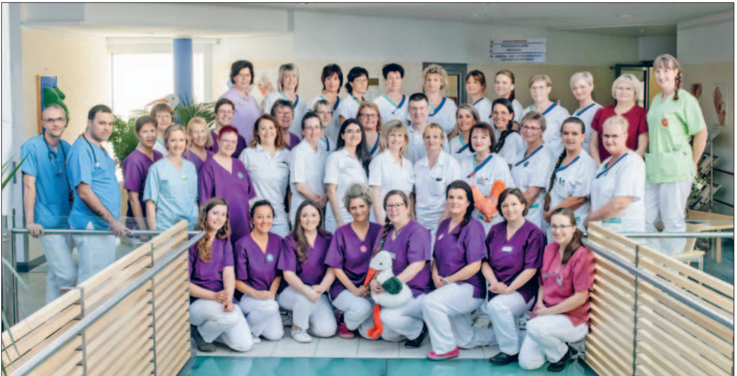
Das Team der Geburtshilfe im Klinikum Mittweida freut sich am 30. Mai auf seine Gäste