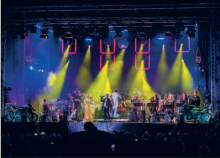
Oberlungwitz besico-Tribüne PRaSR 2023.07.01 23

Am 13. Juni 2026 verwandelt sich der Technikumplatz erneut in eine eindrucksvoll inszenierte Bühne. Faszinierende Lichtinstallationen schaffen eine einzigartige Atmosphäre und bilden den perfekten Rahmen für ein außergewöhnliches Konzerterlebnis.