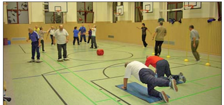
Koronarsportgruppe beim Üben

Der Begriff "Sport" soll den Diabetespatienten nicht abschrecken. In unseren Übungsstunden wird der Körper weder schweißtreibend belastet, noch werden messbare Höchstleistungen angepeilt. Vielmehr wird in einer homogenen Gruppe langsam und spielerisch an sportliche Bewegungen herangeführt. Die Übungen sind abwechslungsreich und werden teilweise mit Musik unterlegt.