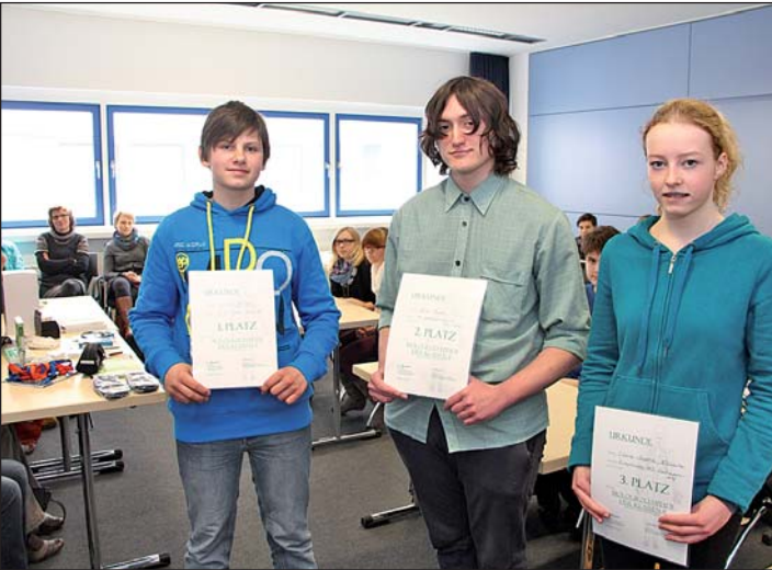
Die drei erstplatzierten Schüler