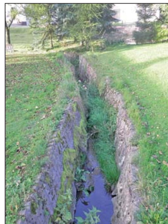
Da wo genügend Platz ist, sollten Ufermauern in abgeflachte Böschungen umgelegt werden.

Die Errichtung von baulichen Anlagen (Gebäude, Terrassen, Treppen, Zäune, etc.) ist verboten, da diese im Hochwasserfall ein Abflusshindernis darstellen. Über die Erteilung von Ausnahmegenehmigungen entscheidet die Untere Wasserbehörde.