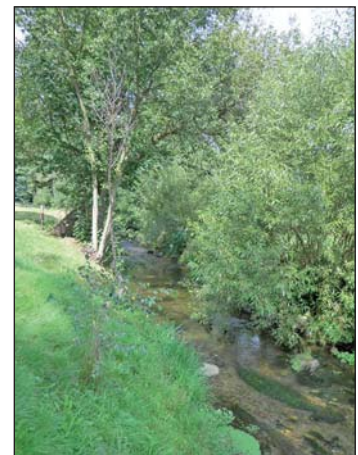
Naturnahe Böschung mit standortgerechter Bepflanzung