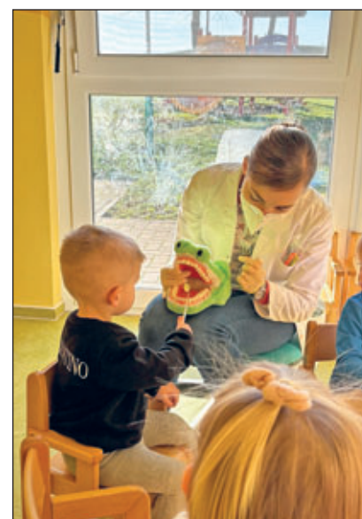
Die Kinder und das Erzieher-team der Kindertageseinrichtung „Bienenkorb“

So vergingen die ersten spannenden und lehrreichen Januar-Wochen, an welchen alle Kinder und Erzieherinnen viel Freude hatten. Bald steht nun die fröhliche Faschingszeit an, auf die sich die Kinder schon freuen. Mit lustigen Kostümen, mit Spielen, Liedern und Tänzchen wollen wir die kalte Jahreszeit vertreiben. "Bienenkorb Helau!!!"