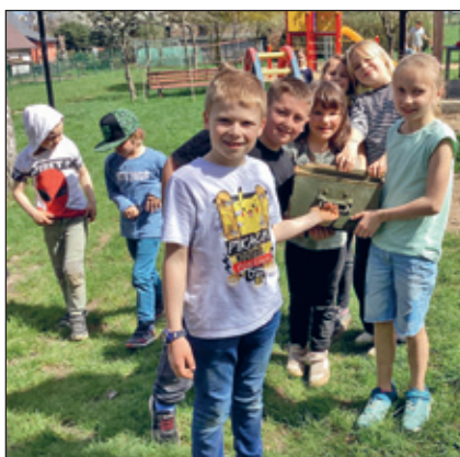
Osterferien fast die bessere Sache an Ostern.

Beim Verstecken der Osternester für die Kindergartenkinder hat der Osterhase doch tatsächlich schon wieder seine Möhren verloren. Dieser Spur folgten die Kinder ganz aufgeregt mit den Erziehern. Nach einer Runde am Bahndamm entlang fanden wir dann eine Schatzkarte, welche jede Gruppe zu den Osterverstecken führte.